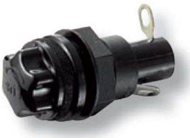
Foto e disegno (dimensioni in mm) / Product image and drawing (dimensions in mm)